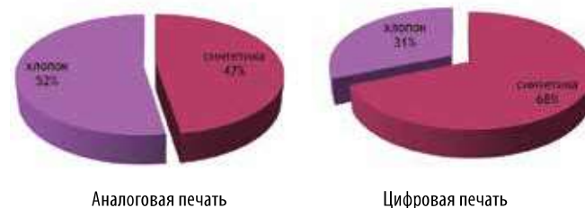
Рис. 3. Материалы для печати

Из них две трети запечатываются сублимацией — синтетические ткани, и одна треть — прямая печать по натуральным тканям. И здесь виден один существующий в настоящее время перекос: ткань, запечатываемая аналоговыми способами более чем на 50 % — это хлопок (рис. 3). Это связано с тем, что размер инвестиций и простота технологии сублимационной печати позволили в первую очередь создавать печатные производства для работы с синтетическими тканями. Но будущее за печатью по натуральным тканям!